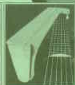
Alu-Einlagen garantieren ewige Formbeständigkeit des Halses –