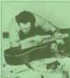
hohes handwerkliches Können –