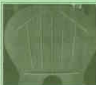
wie in der Bearbeitung der Decke