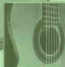
und die Gesamtverarbeitung: eine Augenweide für den Kenner!