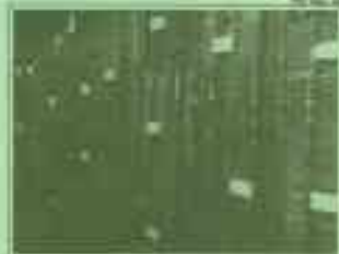
Lange abgelagerte edle Hölzer –