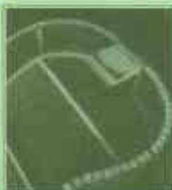
erkennbar im hervorragend gearbeiteten Innenleben –