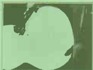
laufende Maßkontrollen –